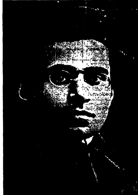
Una classica immagine di Antonio Gramsci

Uniti e una «sperata» a Mosca. Tale contemporaneità ha rappresentato l'attualità dell'«omaggio a Gramsci» (titolo generale di queste giornate) in un modo che ha segnato la distanza almeno tendenziale da quelle «false attualizzazioni» del pensiero di Gramsci da cui ha messo in guardia, con lucidità e passione, Giuseppe Fiori. Francesco Buey, David Forgacs, Johanna Borek, Antonio Santucci hanno indicato, con accenti diversi, la qualità anti-ideologica del metodo gramsciano; Buey prospettando un'«etica della resistenza» e un «razionalismo ben temperato» come luoghi di riappropriazione insieme filologica e politica dell'opera di Gramsci; Forgacs «confessando» un'inquietante dialettica che questa opera oggi consentirebbe di stabilire tra marxismo e nuove frontiere del mutamento (in particolare