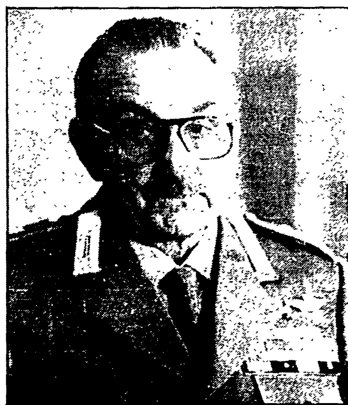
Lino Ventura nel ruolo del generale Dalla Chiesa nel film «Cento giorni a Palermo»

Tante le assenze «importanti» - Non si è fatta vedere nemmeno Eida Pucci